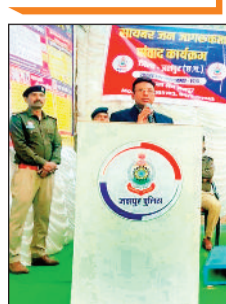
जशपुरनगर

तेज रफ्तार और लापरवाही से बढ़ती सड़क दुर्घटनाओं पर अंकुश लगाने के लिए जशपुर में एक अनोखी पहल देखने को मिली। कम्युनिटी पुलिसिंग के तहत सजल गुप्त महिला समूह की पहलियाँ सड़क पर उतरतीं और वाहन चालकों को सख्ती नहीं, बल्कि संवेदनशील तरीके से यातायात नियमों का महत्व समझाया।